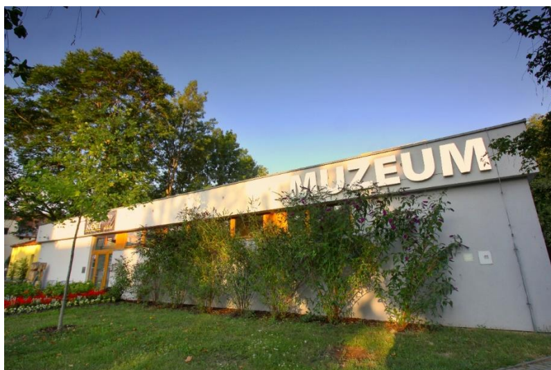
Budova MMG pod vodárnou.