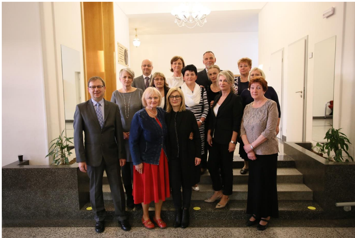
Ocenění pedagogové s představiteli města.