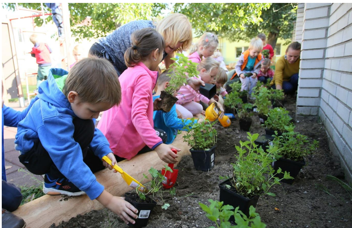
Při tvorbě nové zahrady přiložily ruku k dílu i děti ze školky.

Novou přírodní zahradu získaly děti v mateřské škole v Charvátské Nové Vsi. Koncepte návrhu vycházela z cíle děti více zapojit do zahrady, vytvořit jim herní zázemí a vytvořit na zahradě více zeleně. Zahrada MŠ byla vybavena skříňkou na ukládání hraček, každá třída získala svůj pěstební záhon, u pískoviště bylo zřízeno molo s posezením a domečky, vysazen byl motýlí kout, vznikl prvek pro posezení s obrazovými hrami, instalovány byly kreslicí a výukové tabule, byly provedeny vegetační úpravy včetně jedlých keřů s podrostem.