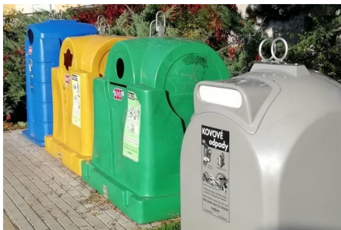
Kontejnery na kovový odpad na sídlišti ČSA v Poštorné.

Ve druhém říjnovém týdnu byly po Břeclavi rozmístěny kontejnery na kovový odpad. "Kontejnery byly rovnoměrně rozmístěny na 10 místech ve všech městských částech. Na všech kontejnerech jsou nálepky, na kterých je uvedeno, na jaký typ odpadů jsou určeny. Primárně by měly sloužit především na nápojové plechovky, "uvedl ředitel technických služeb Karel Osička.