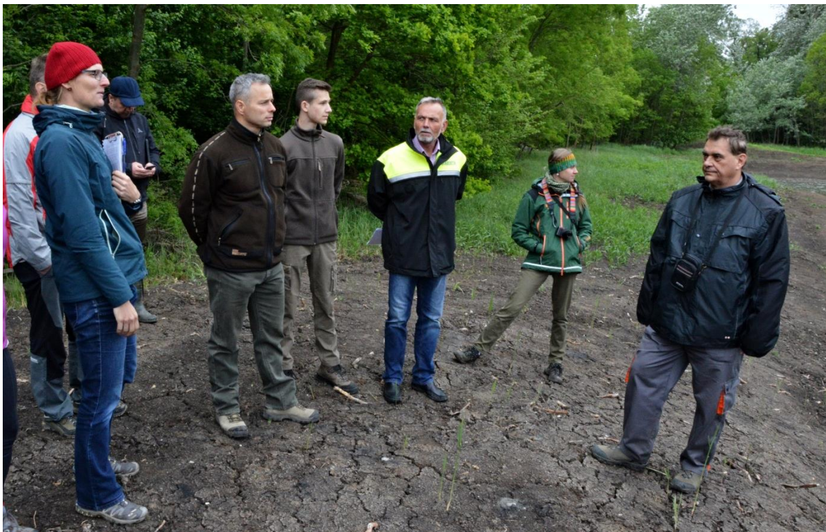
Prohlídka jednoho z kompenzačních opatření, revitalizované tůně Štoglovka.

Brno ŘSD David Fiala a dodal, že v současné době se aktualizuje projektová dokumentace obchvatu. "Předpokládáme, že v roce 2020 požádáme o stavební povolení a s výstavbou začneme hned, jakmile krajský úřad potvrdí, že realizovaná kompenzační opatření jsou účinná."