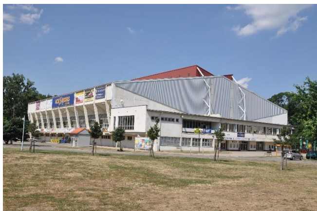
Příspěvková organizace Tereza Břeclav má sídlo na zimním stadionu.

Tereza Břeclav, p.o. se v roce 2019 prioritně věnovala provozování sportovních a volnočasových areálů, které má v zápůjčce od Města Břeclavi. Hlavní změnou v provozu příspěvkové organizace bylo vyčlenění střediska služeb a správy plakátovacích ploch do samostatné organizační složky města Břeclavi k 1. červenci 2019 a převzetí do správy atletického a volnočasového areálu u ZŠ Valtická ke stejnému datu. Ředitelem příspěvkové organizace je od 1. 3. 2020 Ing. Radek Hrdina.