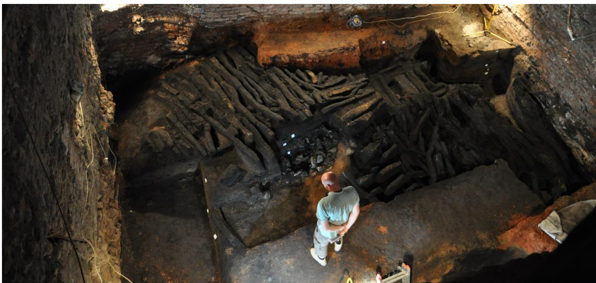
Pozůstatky původní tvrze, která stávala na místě dnešního zámku.