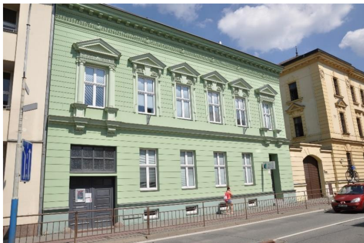
Městská knihovna Břeclav.