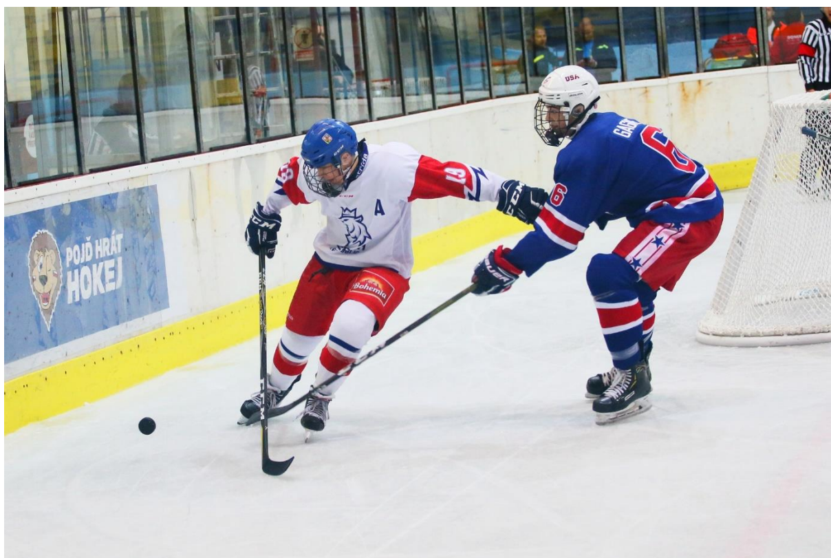
Český tým porazil v zápase o 5. místo Američany.

Opět nezklamali břevclavští diváci, kteří především na zápasy českého týmu chodili v hojném počtu. Souboj se Švýcarskem vidělo 1500 diváků, s Finskem 1910 a s Kanadou 2 200 diváků. Přestože se našim hráčům nedařilo, byla atmosféra na stadionu výborná. Poprvé v historii turnaje vysílala Česká televize přímým přenosem všechny tři zápasy českého týmu v základní skupině, závěrečné duely pak viděli televizní diváci ze záznamu.