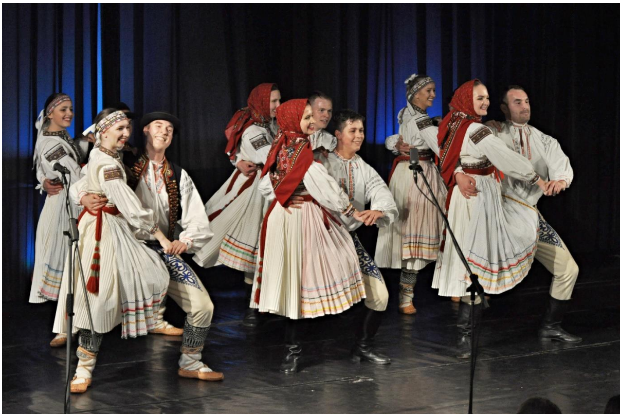
Vystoupení Břeclavanu v kině Koruna.