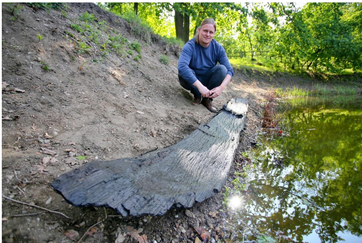
Trosky středověké lodě.

Dva zachovalé kusy vydlabané lodi, na které upozornil archeology náhodný kolemjdoucí, se našly v dubnu při těžbě štěrkopísku na Dyji mezi Vídeňským a Bratislavským mostem v Břeclavi. Podle archeologa Libora Kalčíka z břeclavského muzea šlo o skutečný unikát: „Na řece Dyji nebyl žádný podobný nález doposud zdokumentovaný. V posledních dvaceti letech se navíc podobná loď v České republice nenašla. Zdokumentovaných nálezů ručně dlabaných člunů, které pocházejí z dob od střední doby kamenné do středověku, je přitom v Česku jen několik málo desítek.“ Celá loď mohla být podle prvotních odhadů dlouhá i deset metrů. Její přesné stáří určí analýza dřeva pomocí radiokarbonové metody a dendrochronologie. „Fragmenty lodi mohou klidně pocházet z doby římské nebo z raného středověku. Přesné určení doby vzniku může napomoci mimo jiné i k dotvoření obrazu o splavnosti Dyje,“ uvedl archeolog Kalčík.