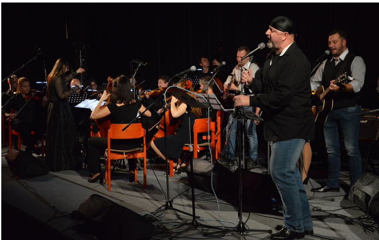
Galakonzert k 30. výročí Sametové revoluce.