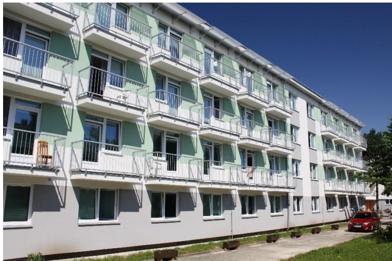
Domov seniorů ve Staré Břeclavi.