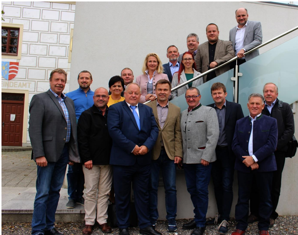
Starostové z příhraničních obcí se sešli na radnici ve Schratzenbergu.

LVA: Břeclav, Lednice, Valtice, Bulhary, Podivín, Hlohovec, Velké Bílovice, Rakvice a Přítluky. Užší spoluprací mají být tak vytvořeny podmínky pro navázání kontaktů občanů z obou stran hranice např. v oblasti kultury, školství a odbourávání jazykových bariér. Zástupci zúčastněných obcí se dohodli, že toto setkání bylo pro všechny velmi přínosné a proto se budou i nadále pravidelně, dvakrát ročně scházet, za účelem dalšího upevnování vzájemné spolupráce.