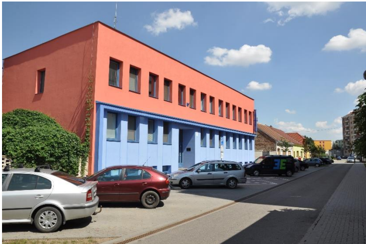
Budova Městské policie Břeclav.