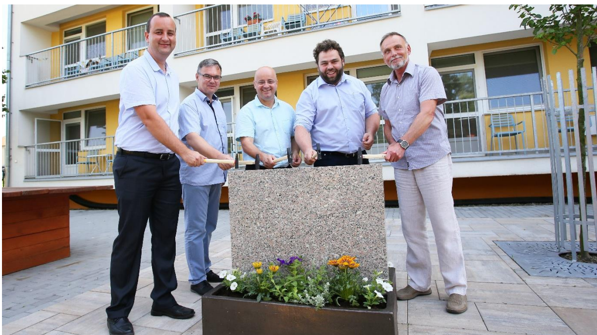
Poklepání základního kamene přístavby Domova seniorů.

V rámci první etapy bylo naplánováno nové zázemí pro technické a stravovací úseky. Původní prostory byly nevyhovující jak po stránce technického stavu, tak i s ohledem na objem činností a logistiku. Celá investice byla vyčíslena na 99,8 milionu korun, 44 milionů získalo město z dotace od ministerstva práce a sociálních věcí.