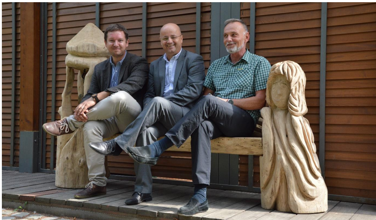
Řezbáři vytvořili pro město originální lavičky.