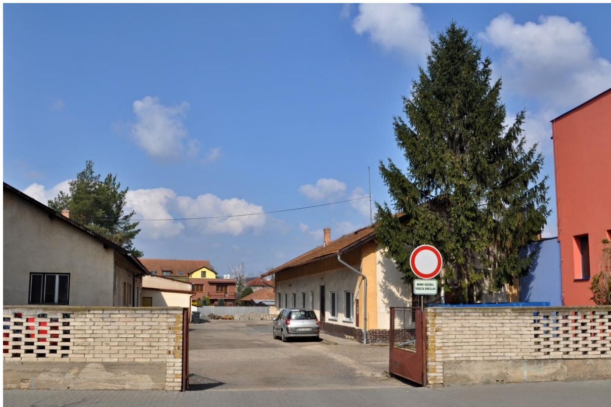
Areál technických služeb na Kupkově ulici.

Primárním úkolem bylo nastavení komunikace s občany, aby byli pracovníci Technických služeb schopni co nejrychleji řešit jejich připomínky a podněty, kterých je 100-200 měsíčně. Lidé mají možnost kromě již existující mobilní aplikace pro hlášení závad využívat naši pevnou linku 519 311 311.