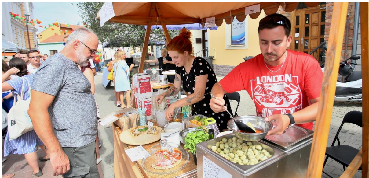
Milovníci dobrého jídla si přišli na své.